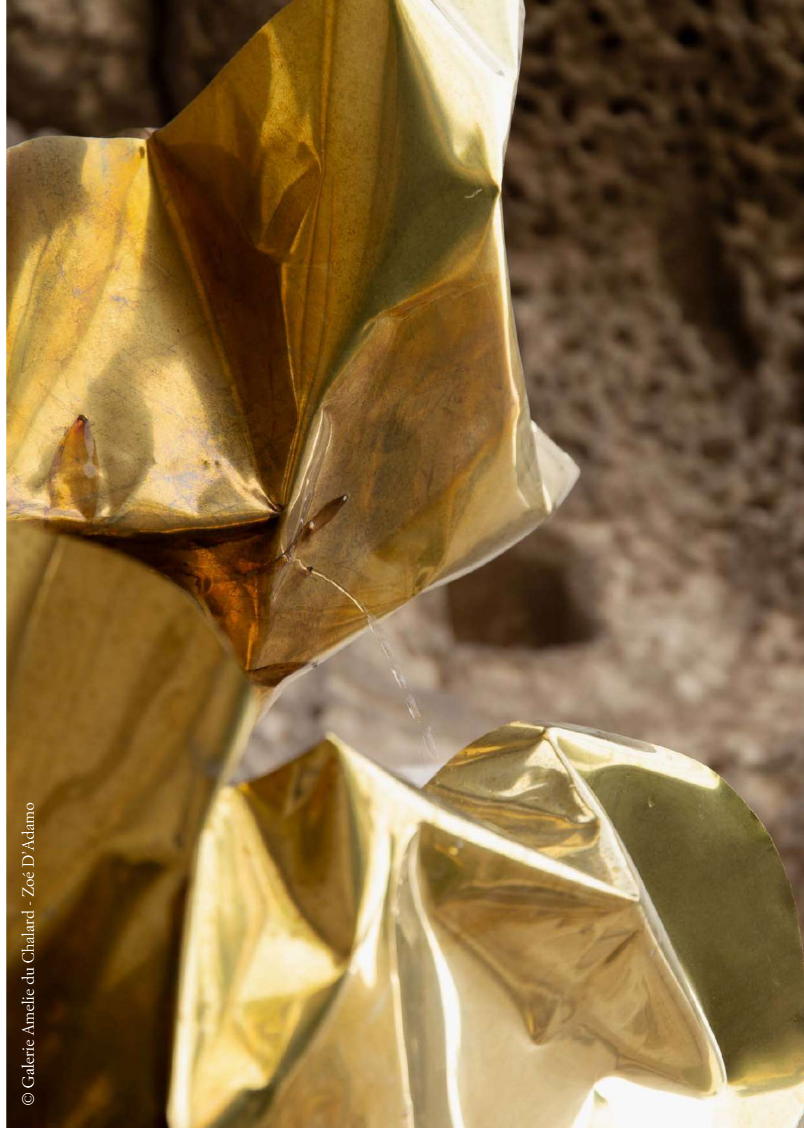
© Galerie Amelie du Chalard - Zoé D'Adamo