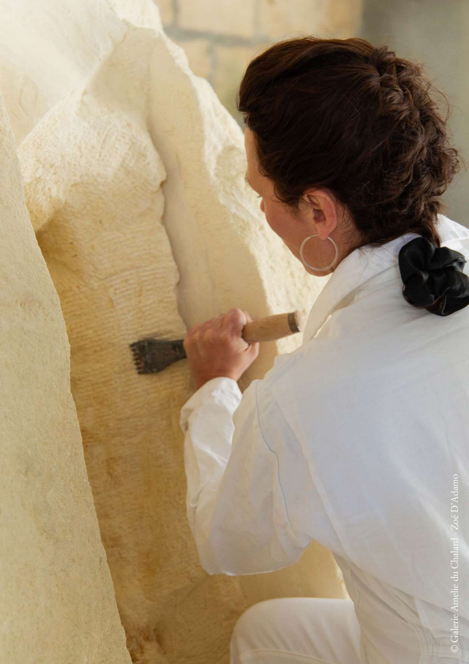
© Galerie Amélie du Chalard - Zoé D'Adamo