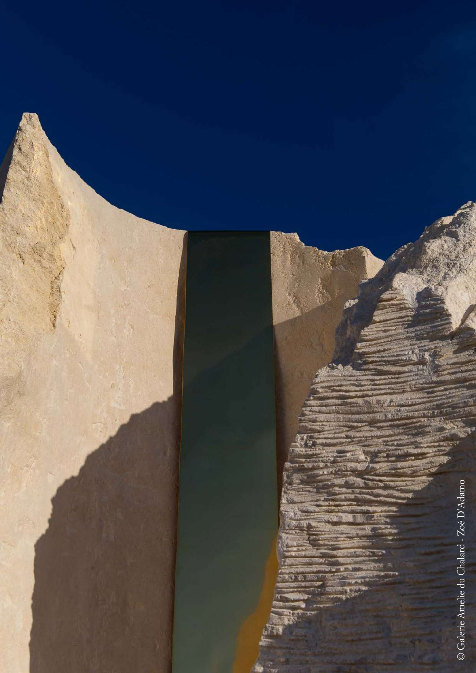
© Galerie Amélie du Chalard - Zoé D'Adamo